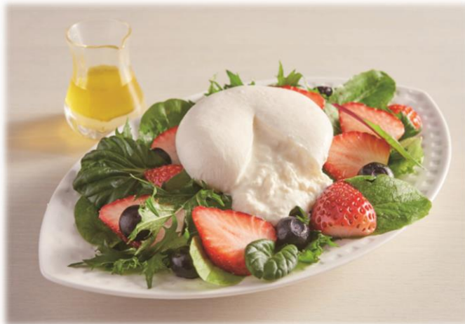
＜まるごとブラータ！フルーツサラダ＞