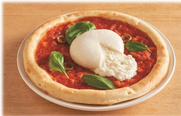
＜まるごとブラータ！ピザ・マルゲリータ＞