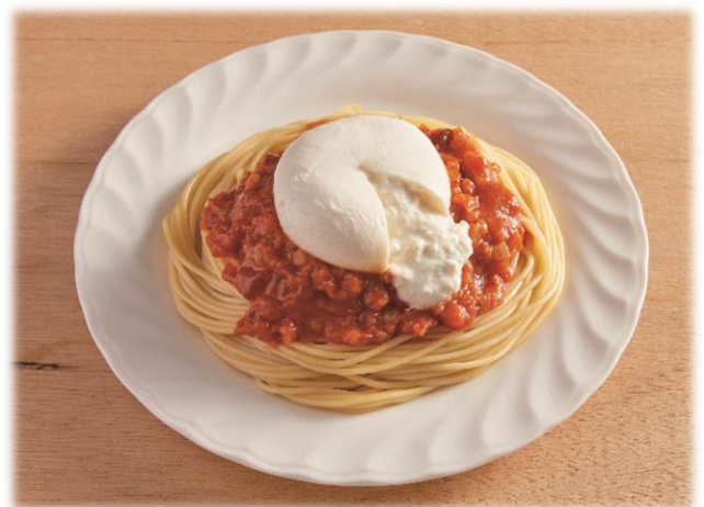
＜まるごとブラータ！ミートスパゲティ＞